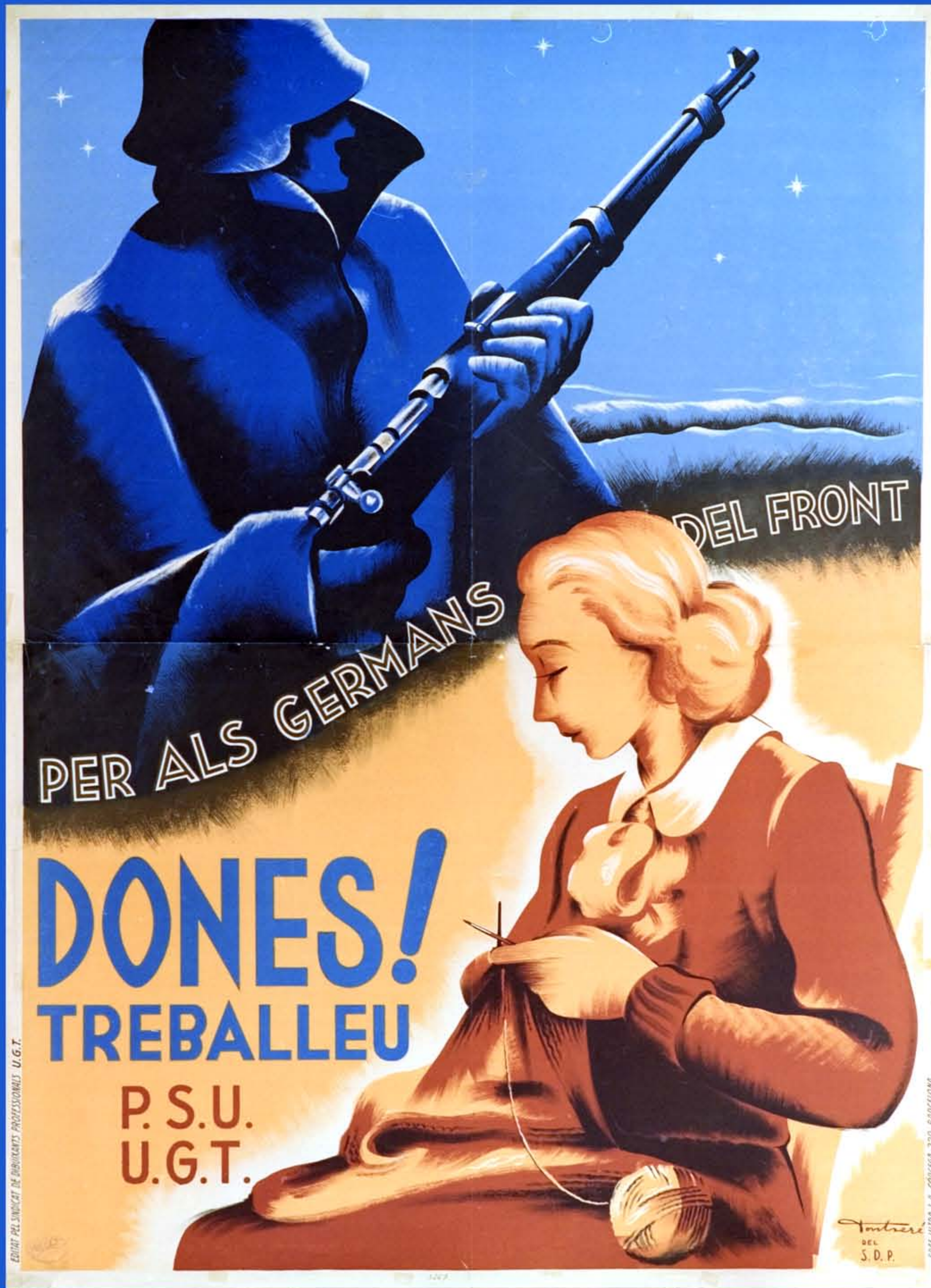
Dones! treballem per als germans del front. 1936 Unitat de catalogació 53. Autor: Carles Fontserè Codi ANC: 1-151-N-53