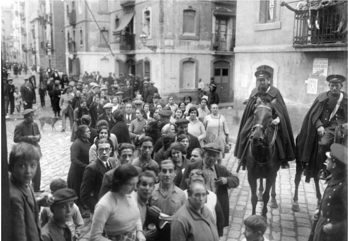
Cua per exercir el vot a les eleccions de diputats a les Corts de la República [19 de novembre de 1933]. Autor: Josep Maria Sagarra i Plana. ANC1-585-N-1944