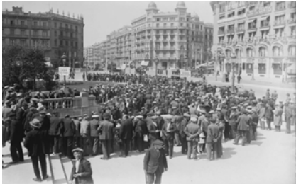
Ciudadans a l'entrada de les oficines del cens electoral per a les eleccions municipals de 1931. [12/04/1931 - 31/12/1931].