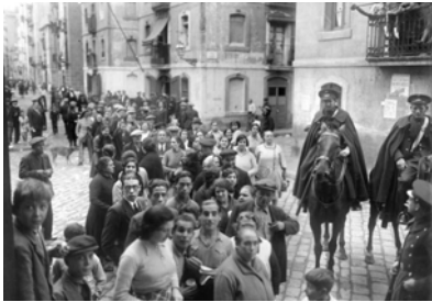
Cua per exercir el vot a les eleccions de diputats a les Corts de la República de 1933. [19 de novembre de 1933]. Autor: Josep Maria Sagarra i Plana. ANC1-585-N-1944.