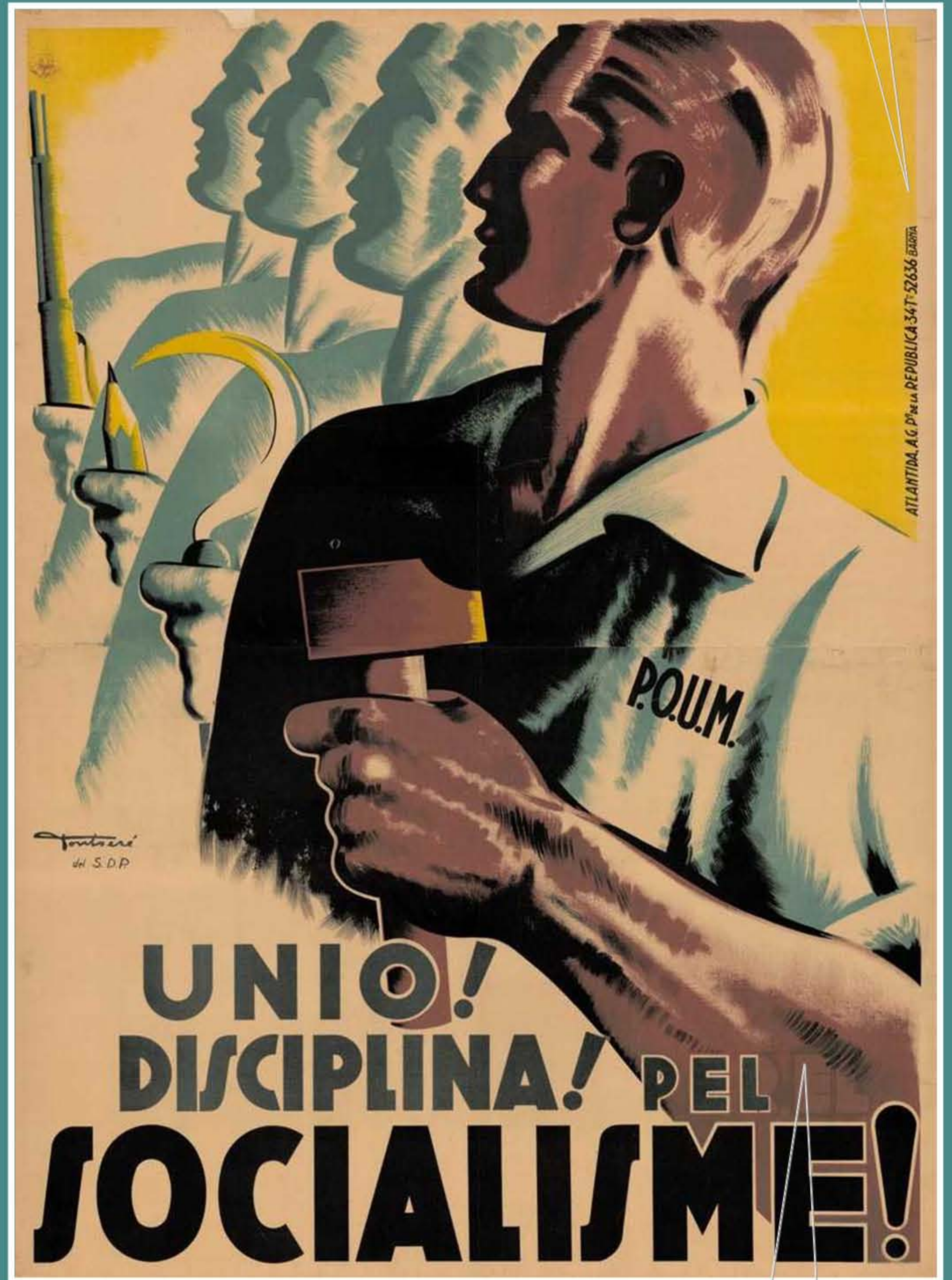
Cartell "Unió! Disciplina! Pel Socialisme". 1937. Arxiu Nacional de Catalunya. Col·lecció Pau Mercadé. Unitat de catalogació 81 Autor: Carles Fontserè. Codi ANC-1-151-N-81

Anàlisi formal: Forma, composició, llum, cromatisme, tècnica Anàlisi conceptual: tema, models plàstics, antecedents, influències posteriors, relacions amb obres similars de l'autor, diferències amb altres solucions coetànies