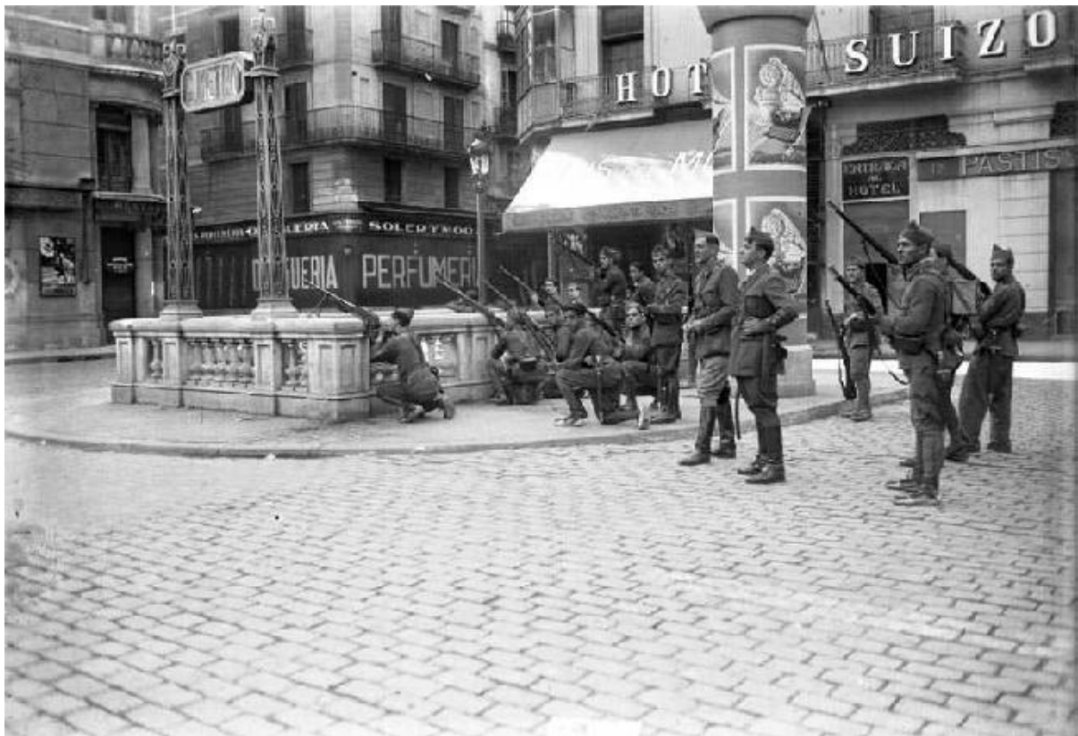
Soldats a la plaça de l'Àngel durant els anomenats Fets d'Octubre de 1934 Autor: Sagarra i Plana, Josep Maria. Referència: ANC1-585-N-2034