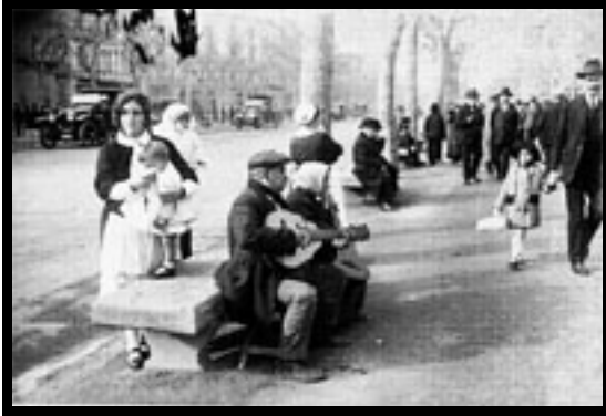
Músics ambulants a Barcelona. [1925 - 1930]

Referència: ANC1-23-N-334; Codi doc ANC@ula: 3073