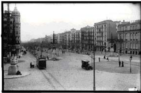
Circulació de vehicles i vianants pel Passeig de Gràcia, arribant al Cinc d'Oros, nom popular que rep la cruïlla del Passeig de Gràcia amb l'Avinguda diagonal. [1910 -1920]

Referència: ANC1-23-N-334; Codi doc ANC@ula: 3073