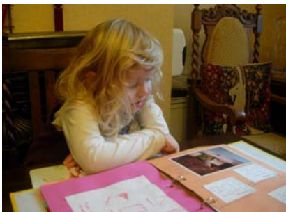
Nena observant un àlbum familiar