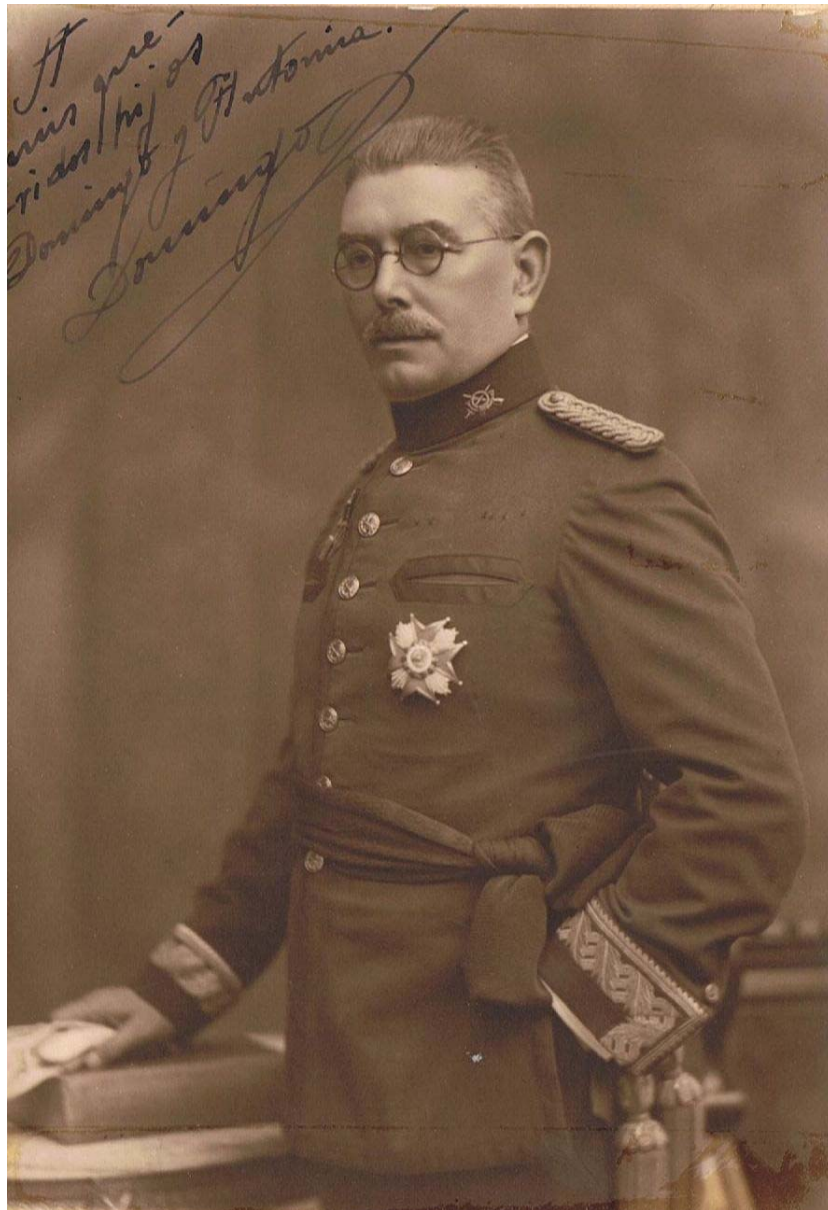
Fotografia del General Batet dedicada als seus fills